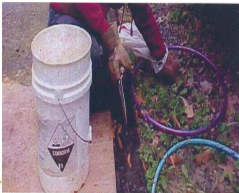
Pull Weeds Inside Hula Hoops