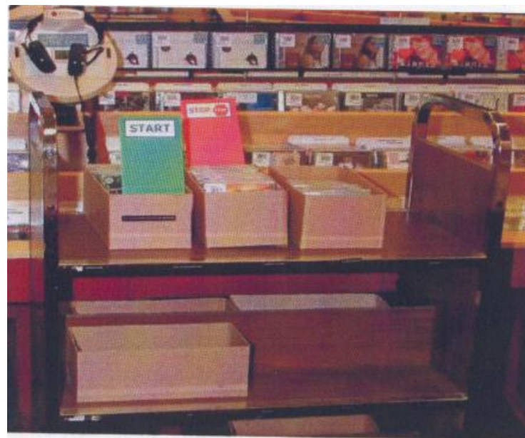
Stock CDs (Start and Finish Visual Cues)