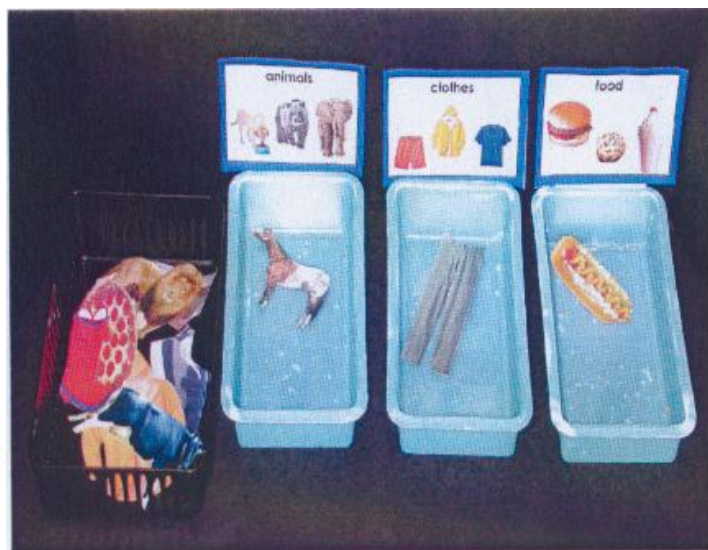
Animals, clothes or food